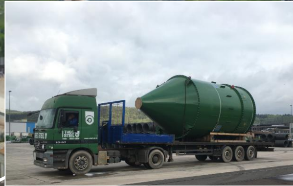
Alles gesichert? > Verladungen & Transporte organisieren